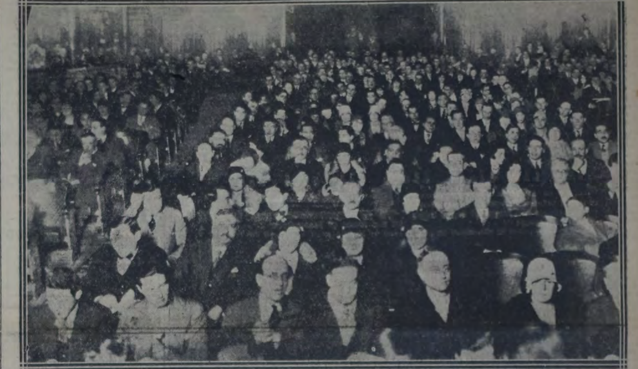
ASPECTO DE LA SALA

Analiza los temas y motivos de los comentarios y editoriales en diversas épocas para deducir algunos cambios fecundos y alentadores, que no son extraños a la obra de "La Vanguardia". Señala así el progreso de la legislación civil, electoral y del trabajo operado en este ciclo de veinticinco años lo que demuestra una persistencia en las fuerzas impulsivas del progreso, que ni aquí ni en ninguna parte se realiza siguiendo una impecable y continua línea recta.