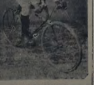
EL JOVEN SCHUTZE